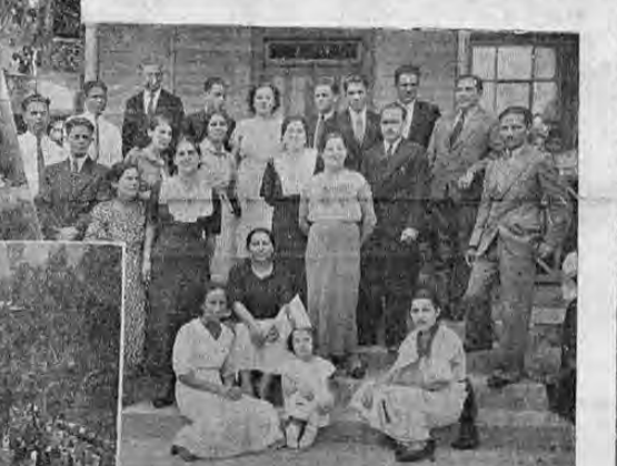
La celebración de los festejos patrios, en la ciudad de Turrialba alcanzaron este año singular esplendor. La foto recoge: parte superior, procesión cívica; los alumnos saliendo de la iglesia después del Te Deum.