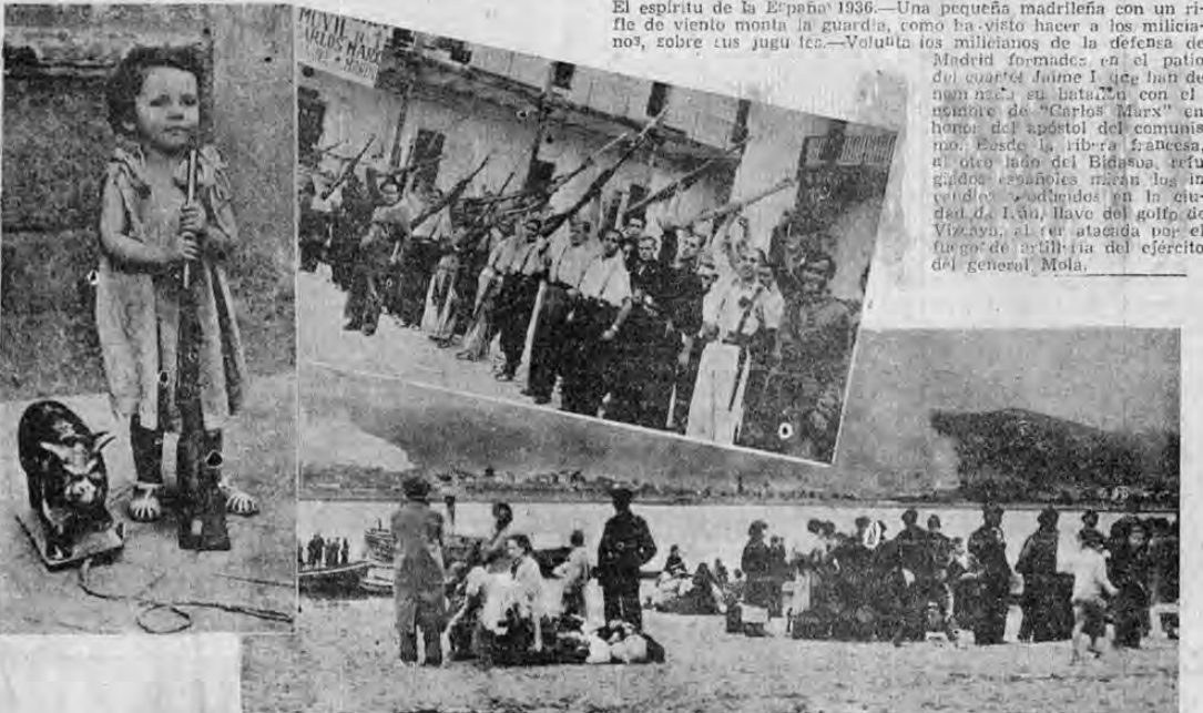
El espíritu de la España 1936.—Una pequeña madrileña con un rifle de viento monta la guardia, como ha visto hacer a los milicianos, sobre sus juguetes.—Voluntarios milicianos de la defensa de Madrid formados en el patio del cuartel Jaime I que han de nombrar su batallón con el nombre de "Carlos Marx" en honor del apóstol del comunismo. Desde la ribera francesa, al otro lado del Bidasoa, se fuertemente españoles marcan los aviones de batallas en la ciudad de Iruñea. Hacia del golfo de Vizcaya, el ferrocarril por el que se transporta el ejército del general Mola.

TALAVERA DE LA REINA, 22.—Desde hace dos días el generalísimo de las fuerzas rebeldes, general Francisco Franco, ha establecido en esta ciudad su cuartel general al que están llegando numerosos batallones de Cáceres, Badajoz y Andalucía. La presencia del general Franco ha dado mayor vigor a las operaciones (PASA a la Página OCHO)